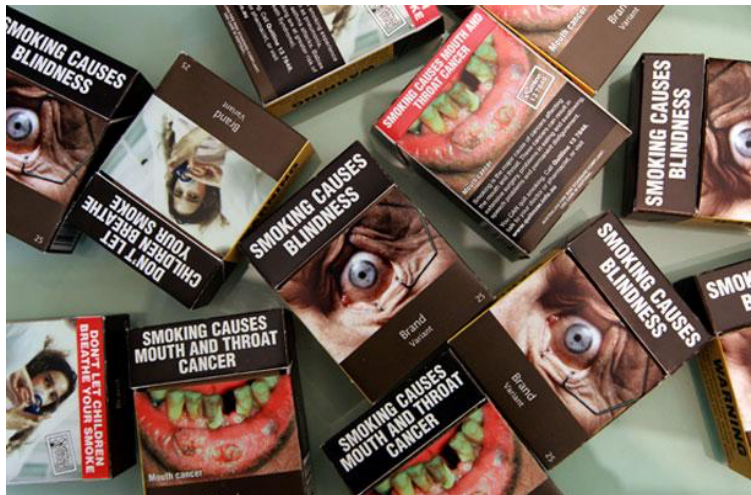
Image 4 : Réflexion en cours autour du paquet de cigarettes neutre