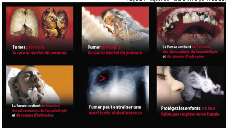
Image 3 : Images obligatoires sur les paquets de cigarettes depuis 2010